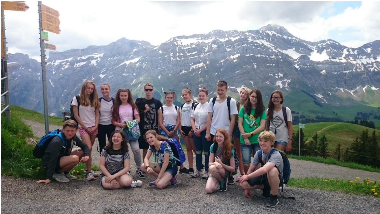
Auf dem Kronberg